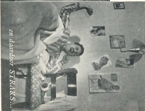
en daardoor STRAKS...